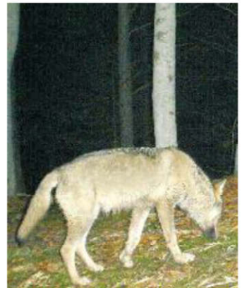
Un lupo nella boscaglia ma vicino alle case, attratto dai cassonetti