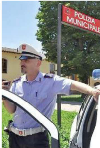
La doppia targa scoperta dai vigili

DOPPIA targa all'automobile per evitare gli autovelox, ma parcheggia in divieto di sosta e i vigili lo scoprono. E' stato segnalato al prefetto e ora è rimasto a piedi per tre mesi. Si tratta di un cittadino valdarnese residente in Inghilterra, che invece di usare l'aplomb tipico d'Oltre Manica ha messo in campo la classica furbizia (si può definire così?) italiana prima di affrontare il viaggio per una vacanza nel nostro e suo Paese, e si è tutelato contro la fitta rete di controlli della velocità applicando due targhe fasulle alla propria auto. Ma se fino al Valdarno qui il viaggio era andato bene,